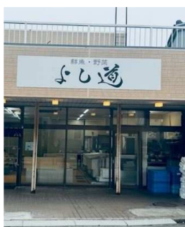
店内には沢山のお魚

ご注文の際は店頭、お電話、FAXにて承りますので是非お待ちしております。冬場はカニの配送等も行っていきます。