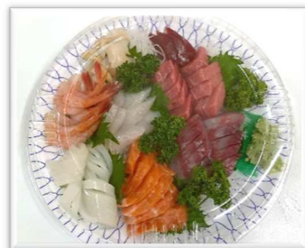
刺身盛り合わせのご注文

36年間で培った魚の販売、仕入のノウハウを生かしてその日に水揚げされた魚が集まる中央卸売市場へ毎日行き、生きのいいものやお客様が欲しいような商品を見つけて店頭で並べているため、新鮮でおいしい魚を少しでも安く地元の人たちに提供することをモットーとしています。自分が選んだ魚を買ってくれたお客様から美味しかったと言ってもらえること、そしてお客様が笑顔になることに一番やりがいを感じています。