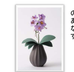
白、ピンク、紫の3色あるミニ胡蝶蘭(花器つき)

繊維が長い和紙には、独特の「透け感」や「揺らぎ」があり、生花とは違った、新たな「生命感」を感じさせます。