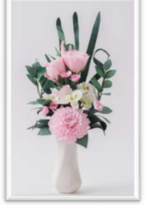
白、ピンク、紫の3色ある凛音(花器無し)

静電気を発生させない和紙は、埃を吸着しにくく、造花にありがちな「すぐにホコリが溜まる」といった現象が起こりません。