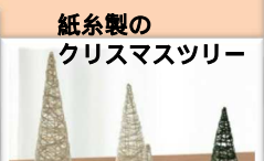
紙系製のクリスマスツリー