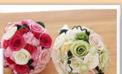
可憐な和紙製ブーケ