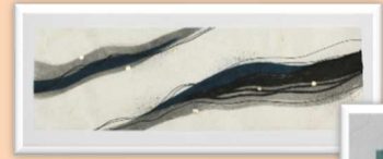
墨の濃淡と金箔がとてもモダンなアートパネル