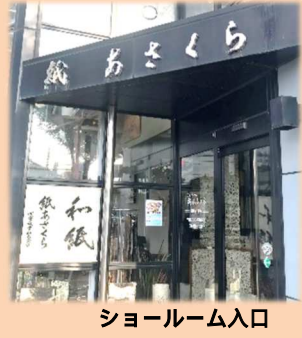
ショールーム入口

オンラインショップでは、限定の創作和紙や和紙製品のほか「届いてすぐに飾ることが出来るアートパネル加工サービス」もおこなっております。これまで弊社では、固定概念にとらわれることなく、新しい加工技術を積極的に取り入れてまいりました。暖かみのある手触りや、光を透過させると浮かび上がる素材感など、和紙が持つ自然な魅力を多くの方に感じていただきたい。私たちはその想いを胸に日々取り組んでいます。これからも、後世に継承すべき日本文化である和紙を国内外に発信するとともに、和紙による豊かな生活を提案してまいります。