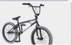
GT BMX スラマー