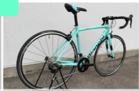
Bianchi VIA NIRONE 7 105

ママチャリと呼ばれている自転車はカゴが付いていて買い物などにも最適です。また、ミニベロと呼ばれる小さめのタイヤの自転車も取り回しが良く街中では便利です。